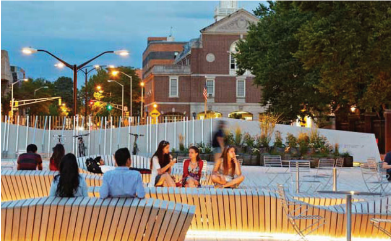
Utilizar muebles de exterior y macetas para crear espacios íntimos para eventos o reuniones más pequeños y para uso diario.