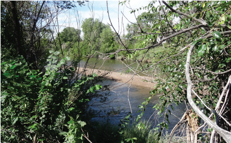
Hoy el río es en gran parte inaccesible.